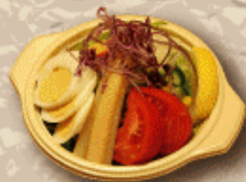
コンビネーションサラダ ¥550