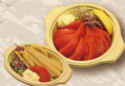
アスパラサラダ トマトサラダ 各 ¥550 マヨネーズ