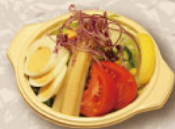
コンビネーションサラダ ¥550